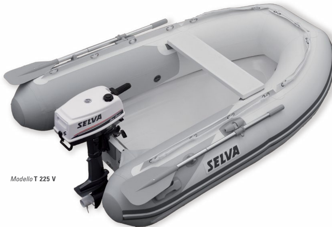
Modello T 225 V