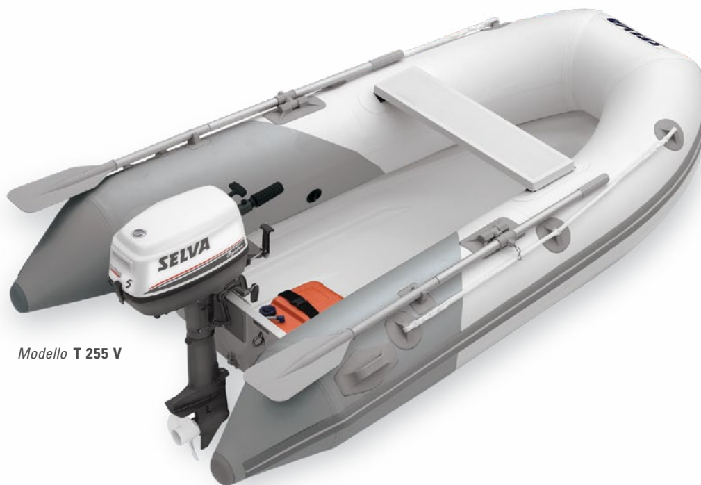
Modello T 255 V