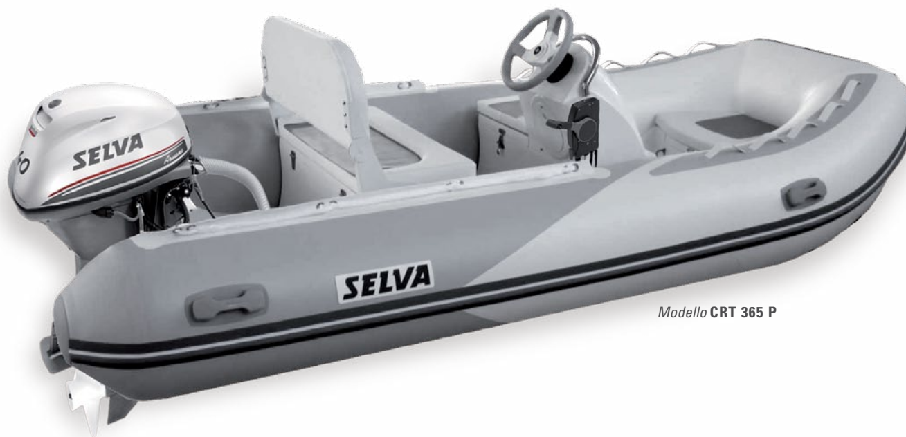
Modello CRT 365 P