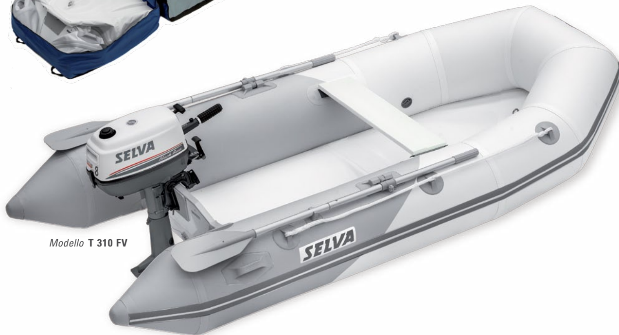
Modello T 310 FV