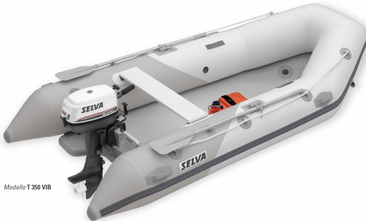
Modello T 350 VIB