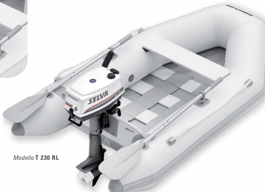
Modello T 230 RL