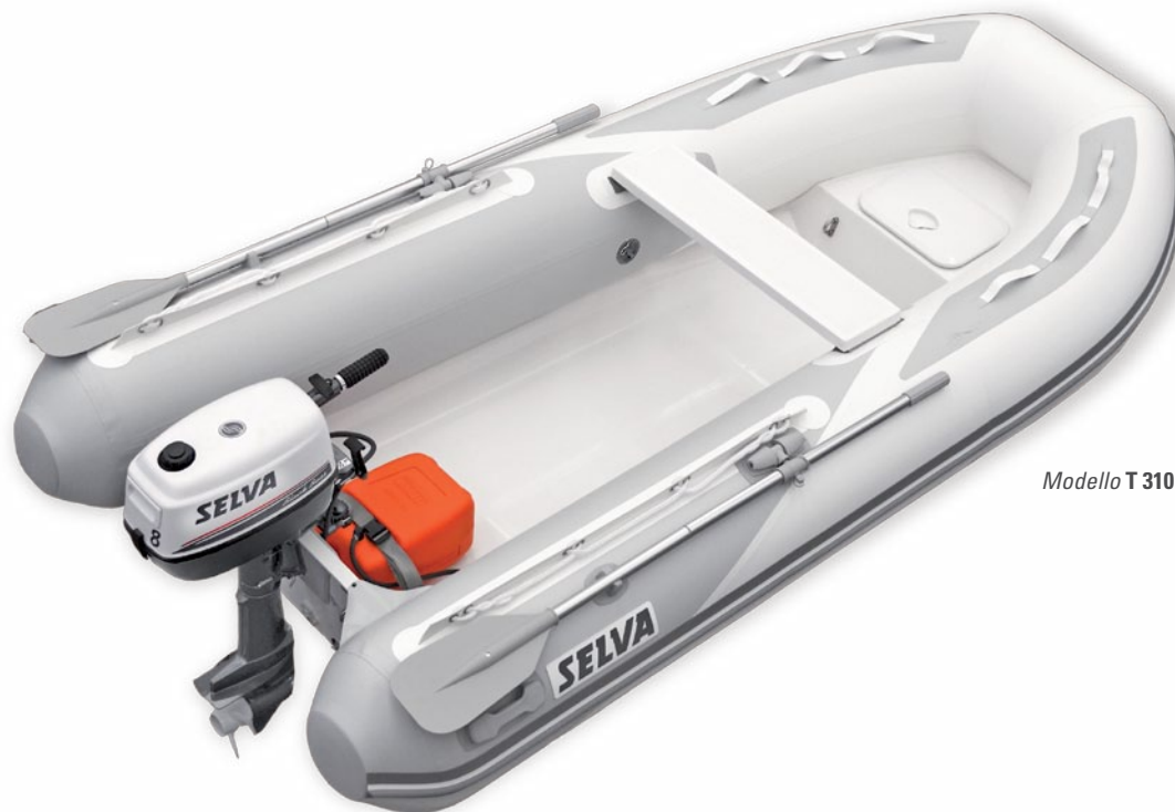
Modello T 310 DV