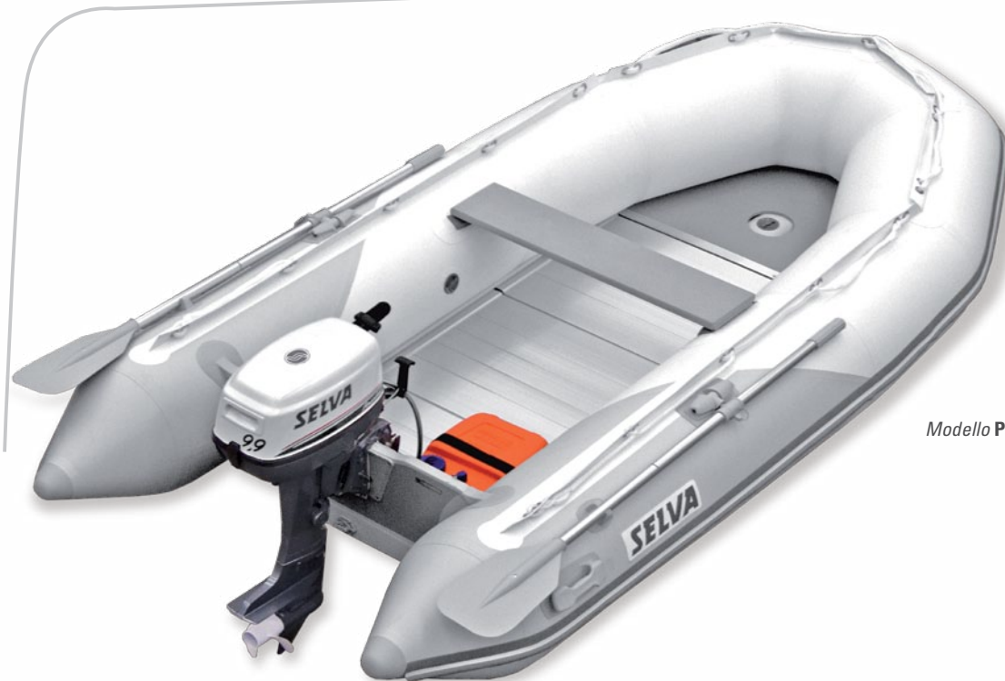
Modello PA 320 ALU