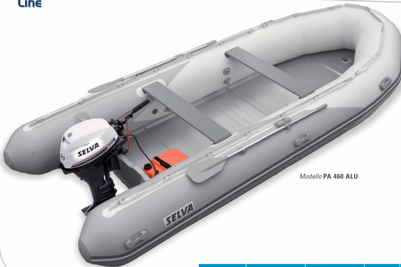
Modello PA 460 ALU